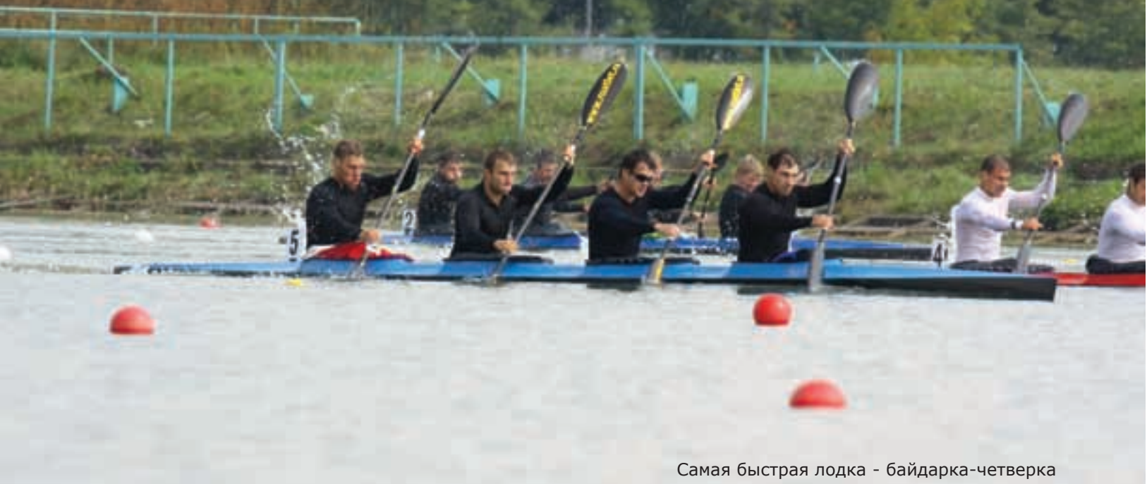
Самая быстрая лодка - байдарка-четверка