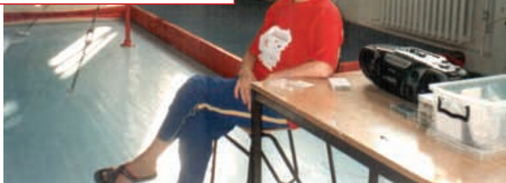
Редкие минуты отдыха