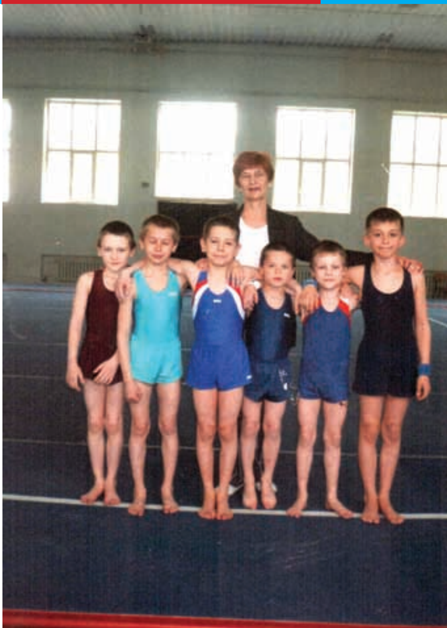
Вместе с учениками