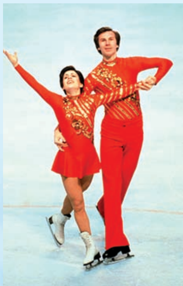
Великолепные Ирина Роднина и Александр Зайцев

В неофициальном командном зачете первое место заняла команда ГДР — 154,5 очка и 24 медали (соответственно 10,7,7). Второе место досталось спортсменам СССР — 147,5 очка и 22 медали (10, 6, 6). На третьем месте оказалась команда США — 99 очков и 12 медалей (6, 4, 2).