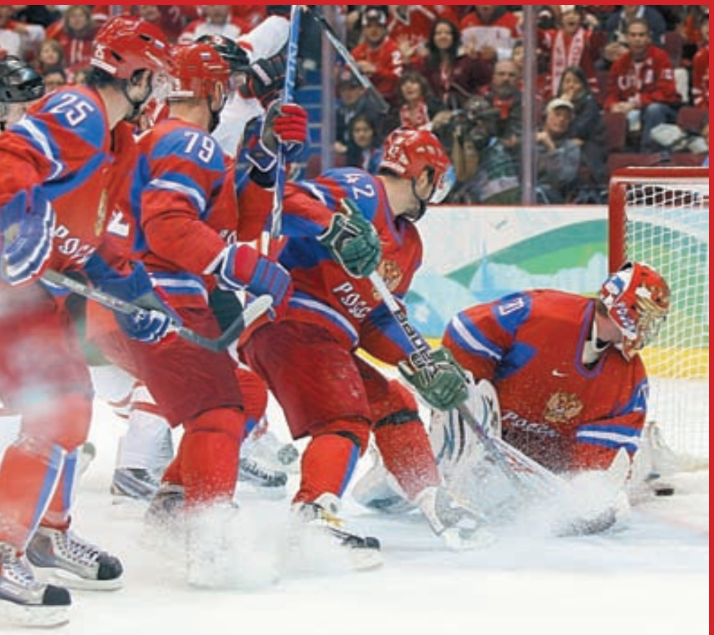
Выступление в Ванкувере закончилось для российской хоккейной «дрим тим» катастрофой

Конечно, потянуть на месте разом такие объекты — утопия, но ведь ничего из названного и в одиночку не сдвинулось. Загляните, в каких условиях трудятся «художницы», фехтовальщицы, о легкой атлетике и говорить не приходится.