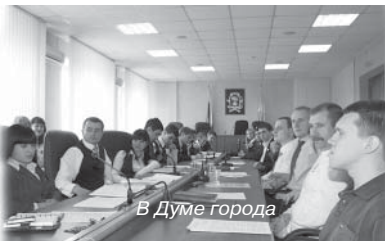
В Думе города