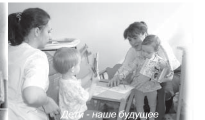
Дети - наше будущее