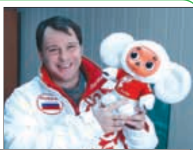
Александр ГОЛУБЕВ, олимпийский чемпион по конькобежному спорту