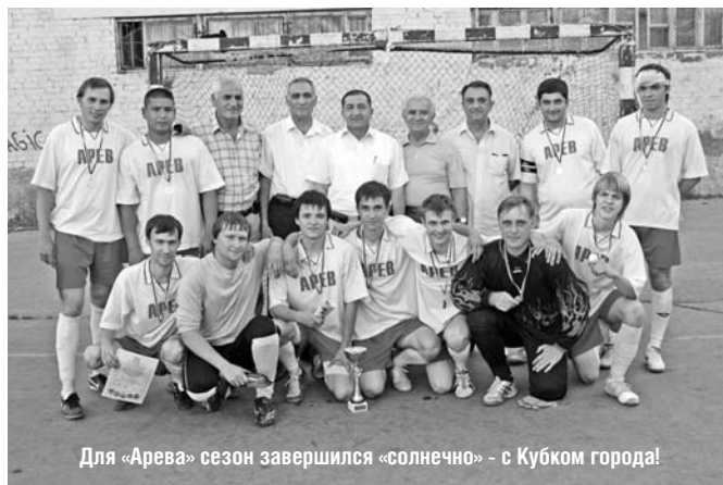
Для «Арева» сезон завершился «солнечно» – с Кубком города!