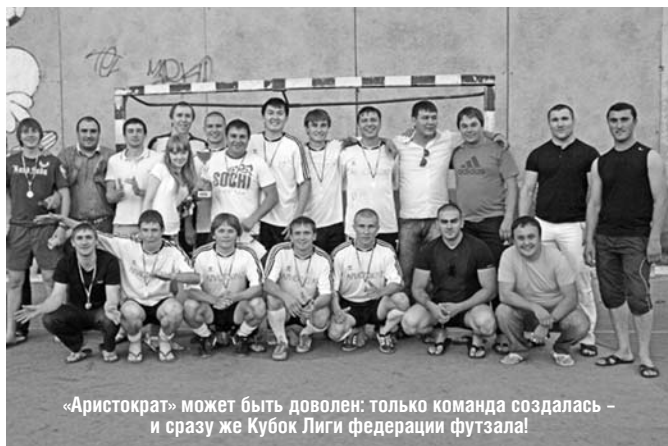
«Аристократ» может быть доволен: только команда создалась – и сразу же Кубок Лиги федерации футзала!