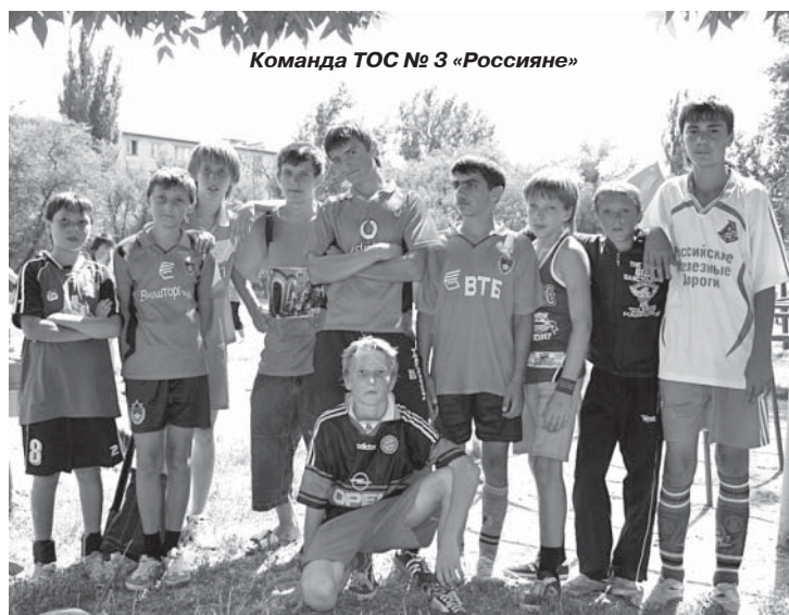
Команда ТОС № 3 «Россияне»

Ребята ответили: - Игра с командой «Россияне» ТОС № 3.