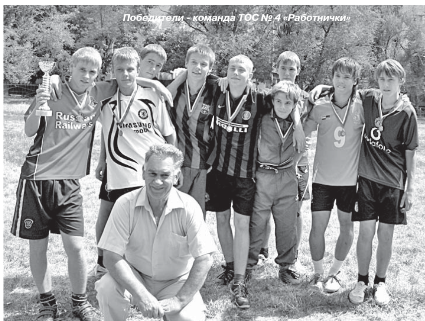
Победители - команда ТОС № 4 «Работнички»

ПЕРВЕНСТВО по футболу среди дворовых команд на Кубок ТОС № 3 проходило впервые. I-е место заняла команда «Работнички» ТОС № 4. II-е место - команда ТОС № 1. III-е место - команда «Адидас» ТОС № 7