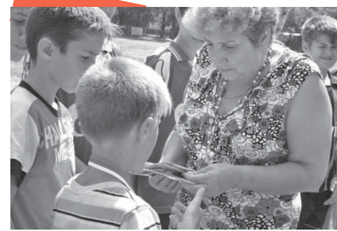
Вручение билетов на киносеанс

Мы решили познакомиться со сборной «Россияне» (на снимке).