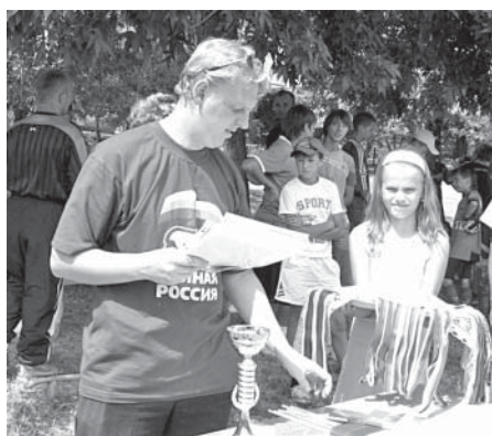
Подготовка к награждению