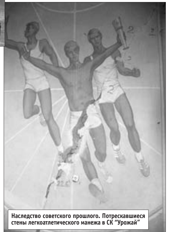
Наследство советского прошлого. Потрескавшиеся стены легкоатлетического манежа в СК "Урожай"

Учредитель: ООО "Держава" Издатель: Федерация спортивных журналистов КО Газета зарегистрирована Верхневолжским МТУ МПТР России Свидетельство о регистрации ПИ № 5-06-36 от 26.02. 2003