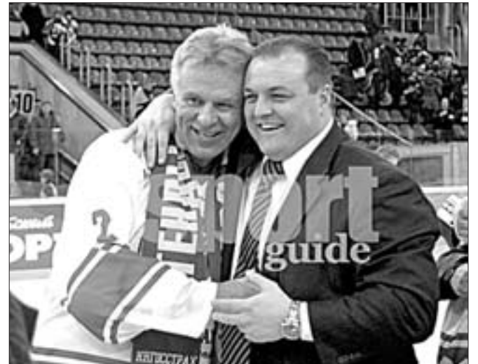
С юбилеем Вячеслава Фетисова, легендарного спортсмена и государственного деятеля, поздравляют председатель Комитета по физической культуре и спорту Костромской области Владимир Захаров и генеральный директор издания "Костромской спорт, туризм и отдых" Камран Бабаев.

Вячеслав Фетисов - двукратный чемпион Олимпийских игр, семикратный чемпион мира, восьмикратный чемпион Европы, тринадцатикратный чемпион СССР, трехкратный обладатель Кубка СССР, трехкратный обладатель Кубка Стэнли, заслуженный мастер спорта СССР, кавалер орденов "За заслуги перед Отечеством" третьей и четвертой степеней, напоминает ИТАР-ТАСС.