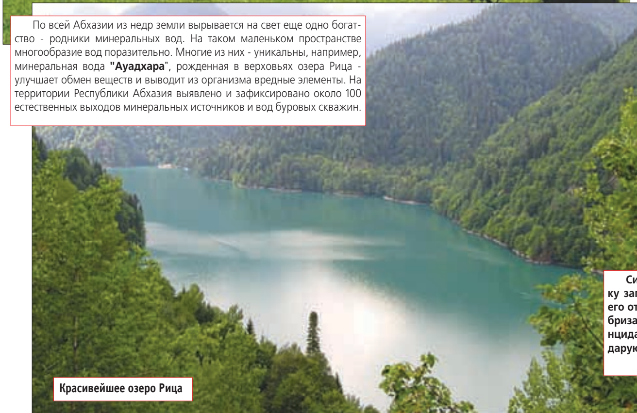
Красивейшее озеро Рица

По всей Абхазии из недр земли вырывается на свет еще одно богатство - родники минеральных вод. На таком маленьком пространстве многообразие вод поразительно. Многие из них - уникальны, например, минеральная вода "Ауадхара", рожденная в верховьях озера Рица - улучшает обмен веществ и выводит из организма вредные элементы. На территории Республики Абхазия выявлено и зафиксировано около 100 естественных выходов минеральных источников и вод буровых скважин.