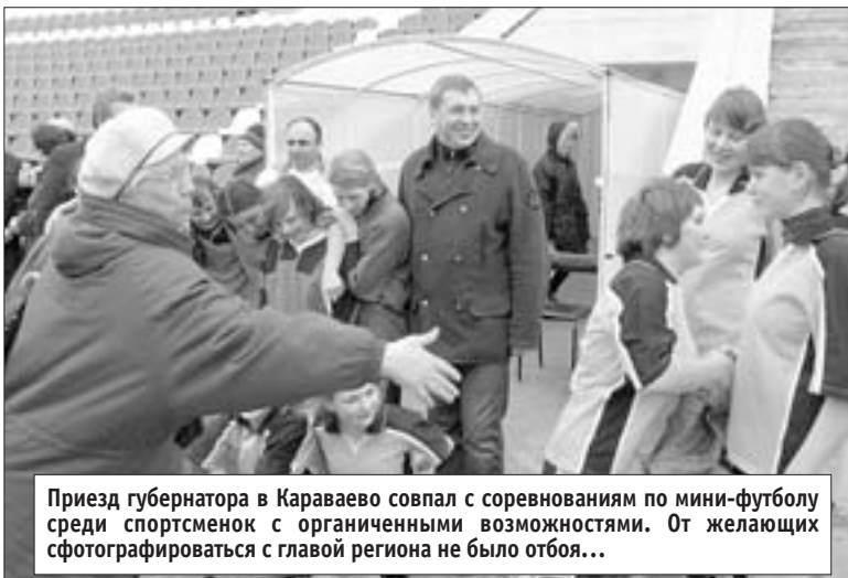
Приезд губернатора в Каравеево совпал с соревнованиями по мини-футболу среди спортсменок с органиченными возможностями. От желающих сфотографироваться с главой региона не было отбоя...