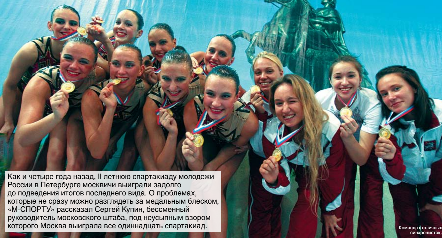
Команда столичных синхронисток.