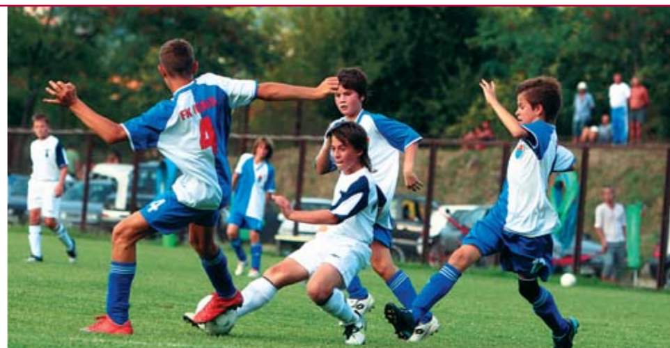
«Торпедо» играет с местным «Игалло».

Каждое утро для обитателей лагеря начиналось с зарядки на пирсе. Отдельной шеренгой выстраивались и шахматисты.