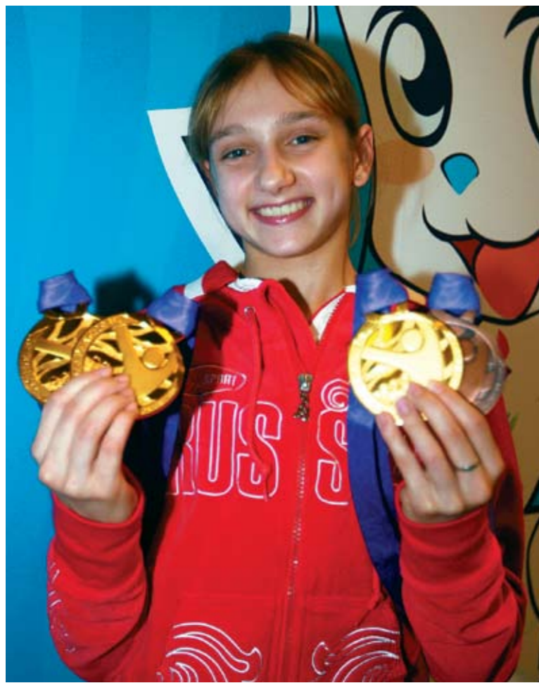
Виктория Комова: 4 медали ЮОИ.

Сразу две столичные спортсменки выиграли личные золотые медали на первых в истории юношеских Олимпийских играх в Сингапуре. Виктория Комова завоевала три медали высшего достоинства в спортивной гимнастике, а Дарья Гаврилова стала лучшей в турнире теннисисток.