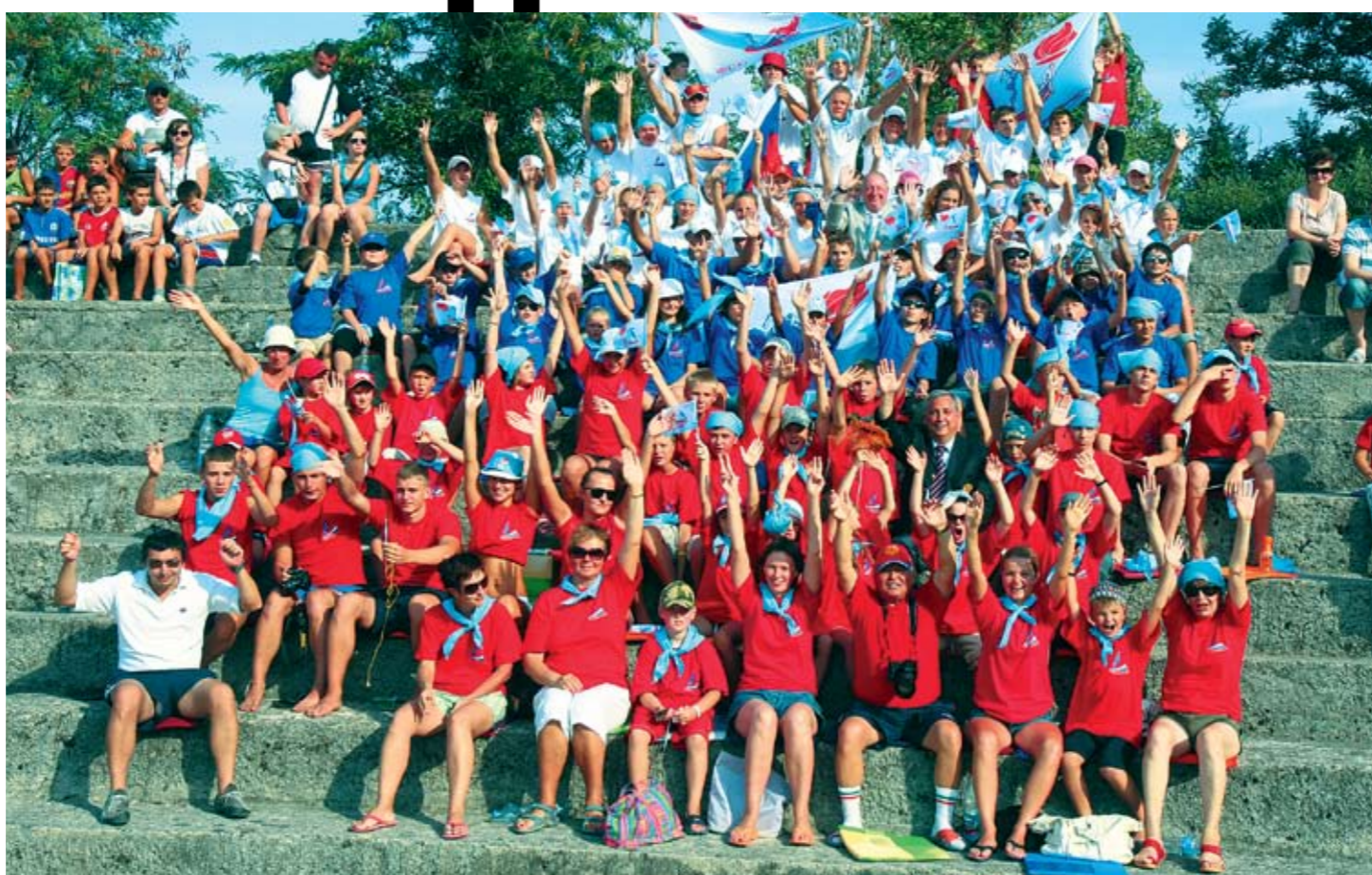
Воспитанники ФСО «Юность Москвы» болеют за своих.

В соревнованиях приняли участие восемь команд из четырех стран: России, Черногории, Сербии и Боснии. Победителем турнира стал сербский коллектив «Югович». Симпатичнее всех из трех московских команд смотрелся «Спартак-2». Красное-белым не хватило совсем немного удачи, чтобы зацепиться за медали.