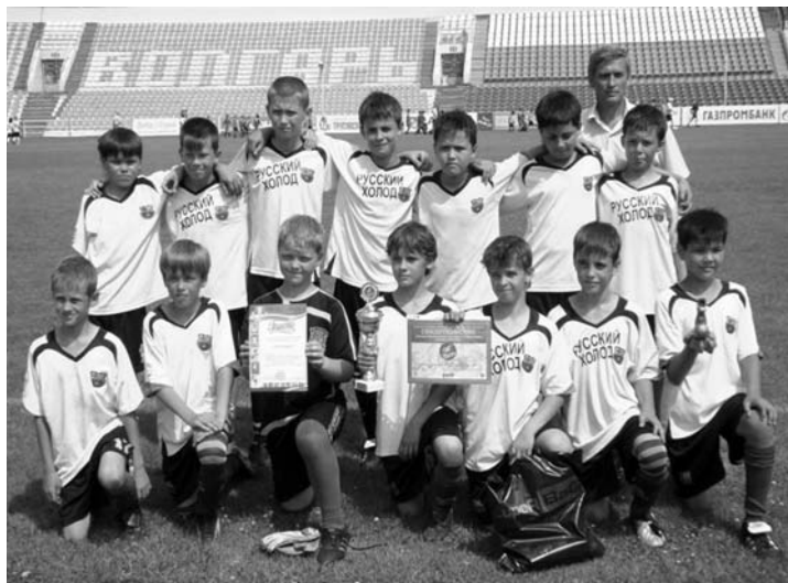
Команда ЦФ «Волгарь-Газпром»-2

Вячеслав Степаня, Фото Людмилы Фартушиной