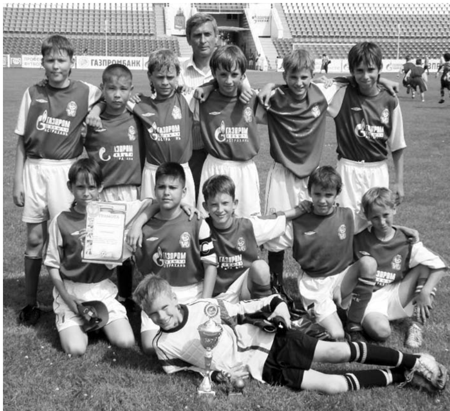
Команда ЦФ «Волгарь-Газпром»-1 – победитель астраханского этапа фестиваля «Локобол-2010-РЖД»

чуть меньший разгром (8:0) второй команде.