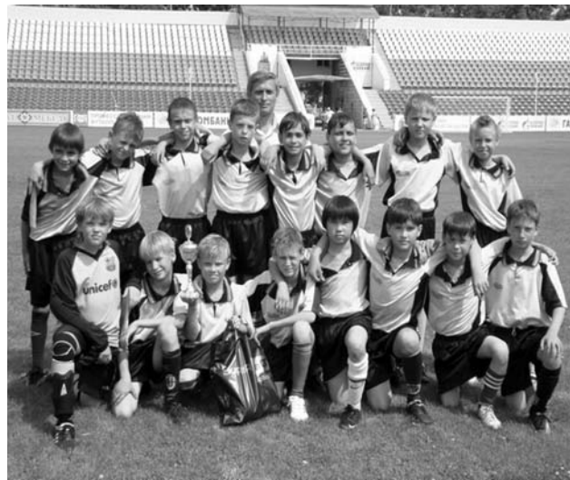
Команда ЦФ «Волгарь-Газпром»-3