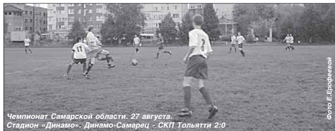
Чемпионат Самарской области. 27 августа. Стадион «Динамо». Динамо-Самарец - СКП Тольятти 2:0