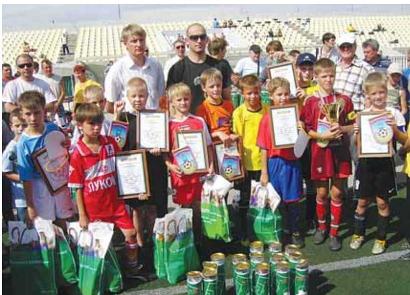
Все участники получили подарки от спонсоров и партнеров турнира