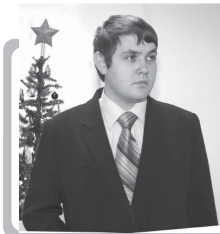
Из зала заседаний Думы г. Невинномысска