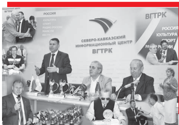
На снимке 2009 г.: в ГТРК «Ставрополье» состоялось торжественное мероприятие по случаю подведения итогов XVIII краевого смотра-конкурса по пропаганде физкультуры, спорта и олимпийского движения среди СМИ.

- На смену первым энтузиастам футбола явилось последнее поколение 50-60 годов. Когда по всей стране раздавались позывные футбольного марша, в Невинномысске футбол тоже был на высоте, - рассказывает его давний