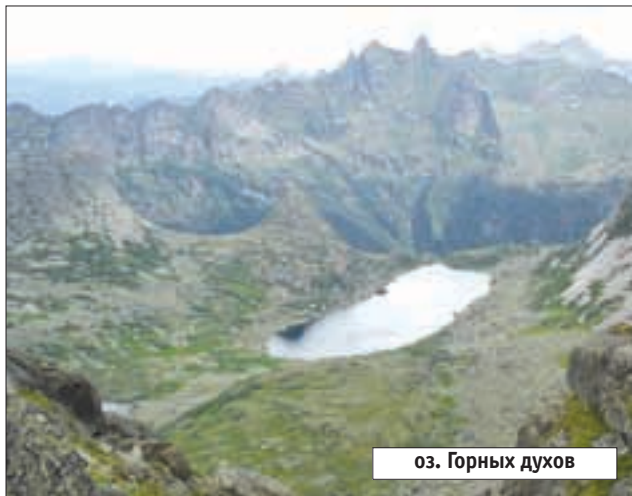
оз. Горных духов

На третий день похода через лес выходим к озеру Золотарному. Здесь не стоят туристы, зато вокруг - множество медвежьих следов. Поднимаемся на перевал Зеленый, с которого открывается панорама озер - Малое и Большое Безрыбное. Спустившись по курумнику с перевала и пройдя через лес, встаем на берегу озера Малое Безрыбное, где на нас набросились полчища мошки. Кстати, на озерах рыба есть, о чем говорит присутствие рыбаков. На следующий день через кедровый лес выходим на озеро Большое Буйбинское. Пообедав на берегу, идем в долину реки Прямой Тайгиш. Начинается дождь. Тропа временами теряется, путь преграждает множество завалов - настоящие Тульские засеки. Давно не ходили по таким труднопроходимым местам. К вечеру спускаемся к Крестам - месту слияния рек Прямой и Правой Тайгиш. Весь следующий день поднимаемся по долине реки Левый Тайгиш. Выходим на ручей Лебяжий с каскадом водопадов и вдоль него поднимаемся к