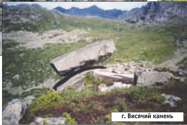
г. Висячий камень

озеру Лебяжью, окруженному грандиозными скальными пиками. Холодает - начинается дождь со снегом. Используя прояснения, идем на штурм перевала Близнец Западный по кулуару. Взяв перевал, траверсируем склон до перевала Близнец Восточный. Уже в семерках, в условиях неустойчивой погоды, спускаемся по скальным плитам и возвращаемся к реке Левый Тайгиш. Итог дня - два перевала: 2А и 1Б. Дождь расходится не на шутку. Следующий день проводим на дневке. Делаем разведку тропы до Стрелки: это большая поляна под пиком Зуб дракона, где есть вертолетная площадка.