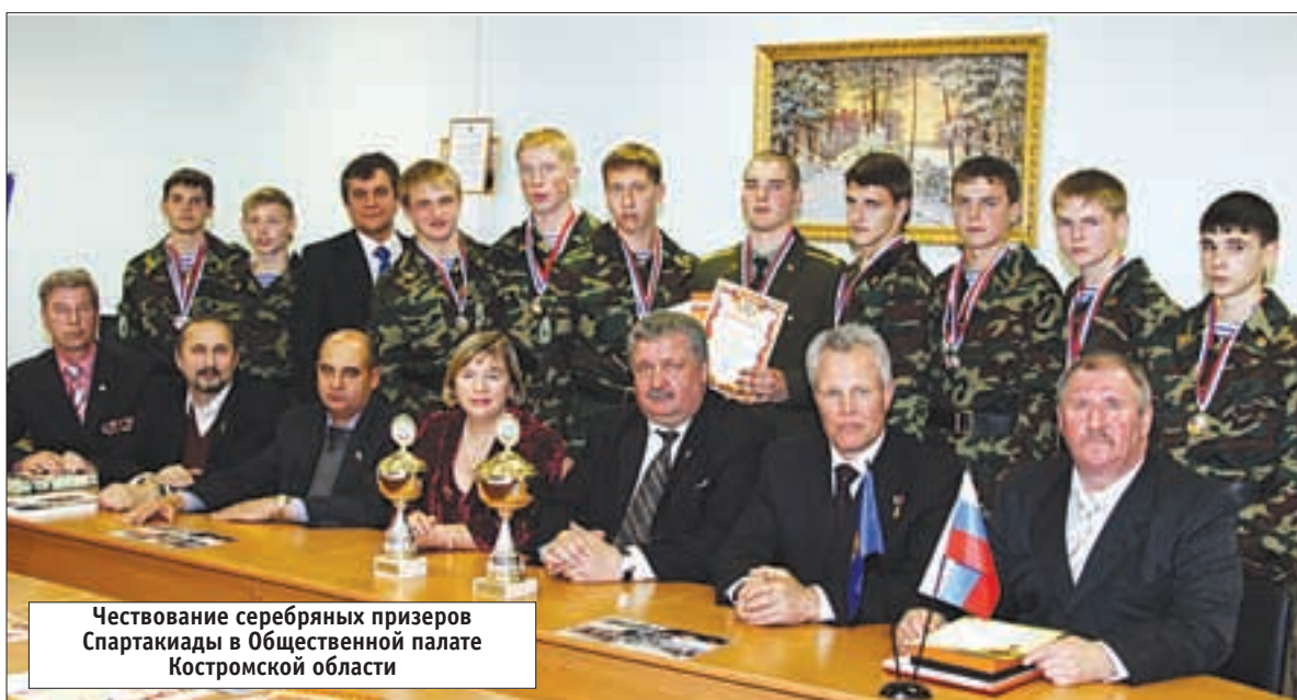
Чествование серебряных призеров Спартакиады в Общественной палате Костромской области