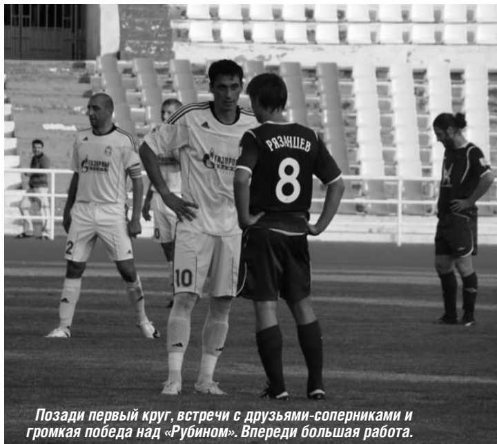
Позади первый круг, встречи с друзьями-соперниками и громкая победа над «Рубином». Впереди большая работа.