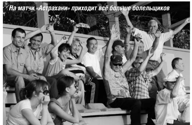
На матчи «Астрахани» приходит всё больше болельщиков

Вот так, уверенно выигрывая у более сильных соперников и на выезде, и у себя на