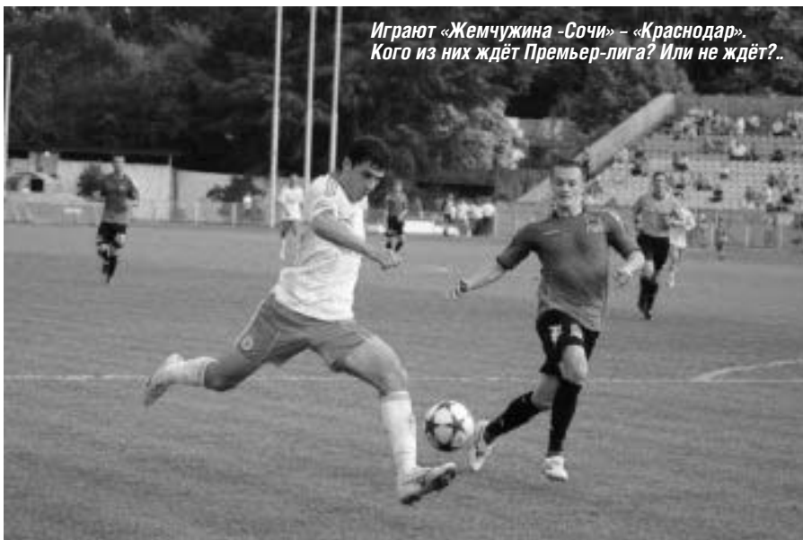
Играют «Жемчужина-Сочи» – «Краснодар». Кого из них ждёт Премьер-лига? Или не ждёт?..

Мучительно адаптируются к новым реалиям выдвиненцы от второго дивизиона. Не все – большинство. В «зоне вылета» – сплошь дебютантские лица, победители да призёры турнира уровнем ниже! Вообще-то, в потенциальные аутсайдеры можно смело зачислить всю вторую половину таблицы, но по факту таковыми сейчас являются «Авангард», «Иртыш», два «Динамо» да «Ротор». И такой расклад, наверное, закономерен – у старожилов турнира всё же больше опыта прохождения этой конкретной дистанции. А новички идут по ней, образно говоря, наугад, набивают шишки и учатся на собственных ошибках. Впрочем, в этом секторе таблицы тоже абсолютно ничего не ясно. Команды движутся