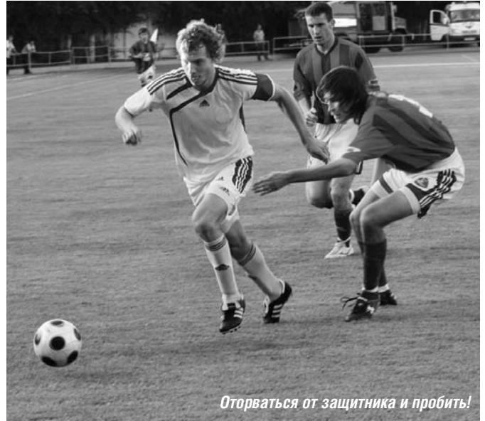
Оторваться от защитника и пробить!