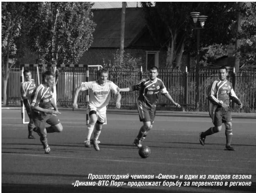
Прошлогодний чемпион «Смена» и один из лидеров сезона «Динамо-ВТС Порт» продолжает борьбу за первенство в регионе