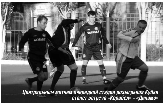
Центральным матчем очередной стадии розыгрыша Кубка станет встреча «Корабел» - «Динамо»

В минувшие выходные состоялись матчи 1/16 финала Кубка Астраханской области. На этом этапе встречались команды первой лиги.