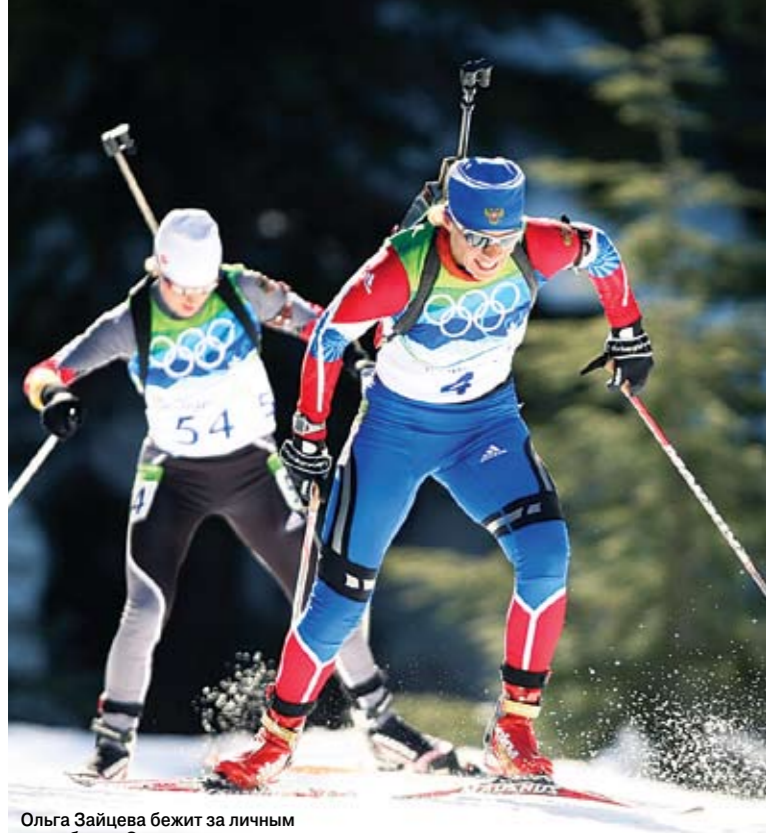
Ольга Зайцева бежит за личным «серебром» Олимпиады.