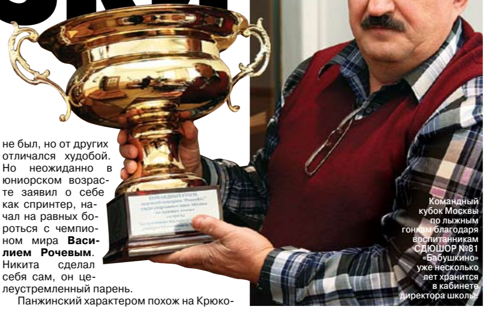
Командный кубок Москвы по лыжным гонкам благодаря воспитанникам СДЮШОР №81 «Бабушкино» уже несколько лет хранится в кабинете директора школы.