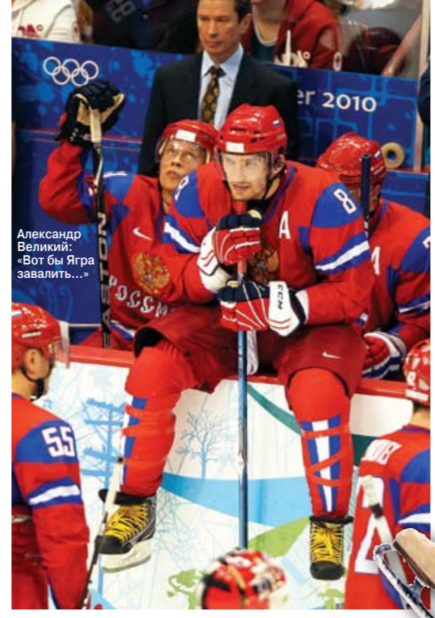
Александр Великий: «Вот бы Ягря завалить...»