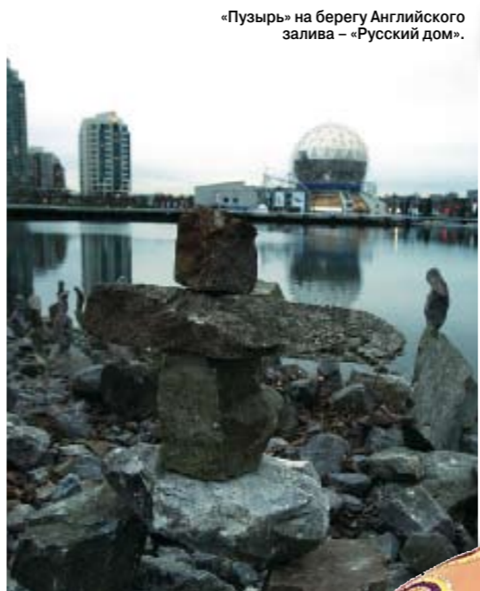
«Пузырь» на берегу Английского залива – «Русский дом».