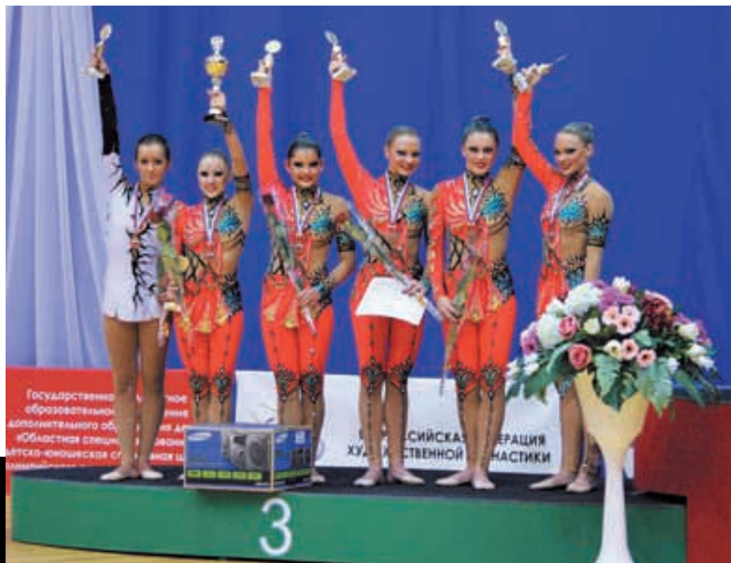
На золотом пьедестале с партнершами по сборной Ростовской области